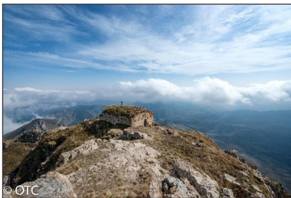
Monastère Katarovank © Hrair Hawk Khatcherian, 5 octobre 2012

Les édifices religieux ont été délibérément bombardés par les troupes azerbaïdjanaises pendant la guerre de 2020 afin de détruire la présence chrétienne et arménienne sur ce territoire. Avec le contrôle de l'Azerbaïdjan sur toute la région, cette menace est plus que jamais d'actualité.