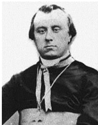
Le jour de son ordination épiscopale en 1863